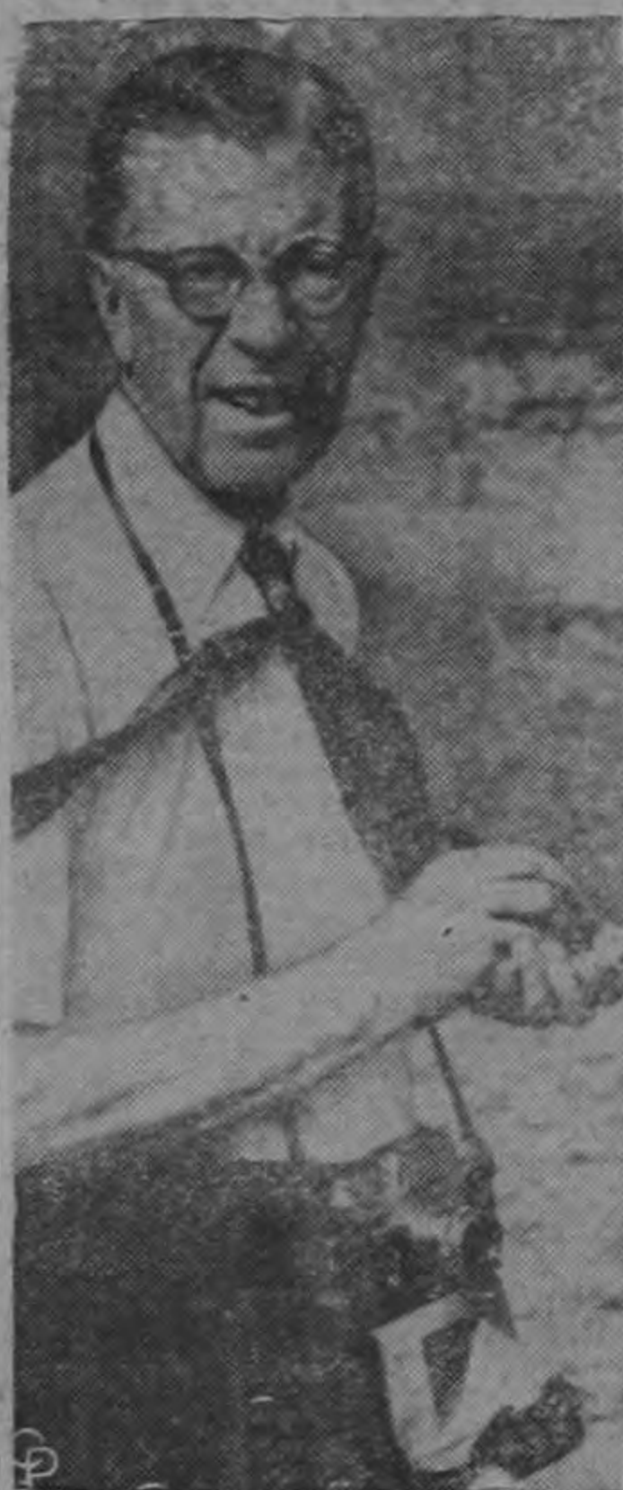
El Rey Gustavo VI de Suecia, sin chaqueta y llevando gemelos, parece un turista mientras pasa sus vacaciones cerca de Siracusa, Sicilia. El Rey y su esposa pasaron varios días en Italia antes de ir a la isla de Malta a visitar al Conde Mounthbatten que es pariente de la Reina.