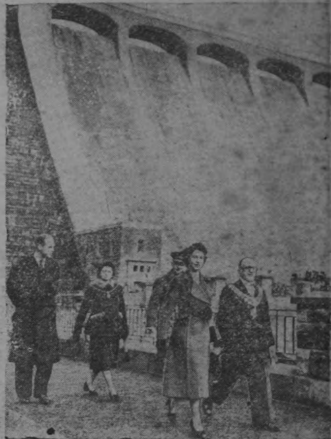
La Reina Isabel II, seguida por su esposo, el Duque de Edimburgo, aparece aquí al ir a inaugurar la nueva presa de Claerwen, la primera de su tipo existente en la Gran Bretaña. La presa fué proyectada por el Bisabuelo de la Reina, Eduardo VII, hace 50 años. Con la Reina aparece el Alcalde de Birmingham, W. T. Bowen. El Duque acompaña a la esposa del Alcalde y a Lord Breckshire.