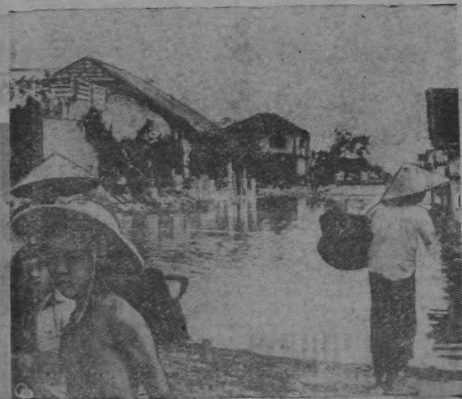
Foto del aspecto que presentaba la población de Phanthiet, Indochina, después de ser azotada por un tifón y un golpe de mar. Hasta ahora han sido encontrados 30 cadáveres y hay además centenares de desaparecidos. Gran número de personas vivían en pequeñas embarcaciones en la bahía y fueron arrastradas hacia alta mar por la ola de más de 30 metros de alto.