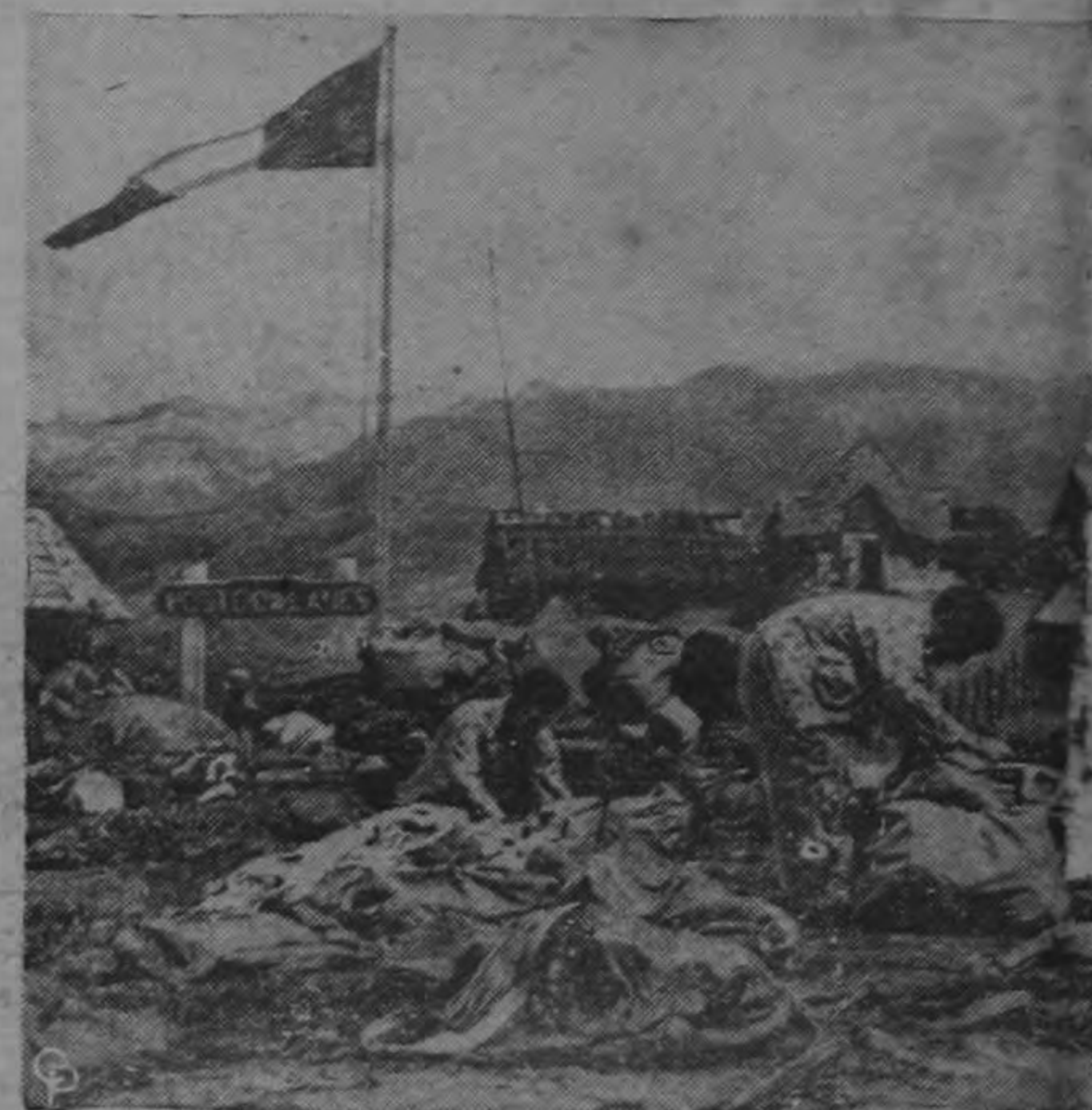
Paracaidistas franceses revisan sus equipos después de descender sobre la región montañosa del Noroeste del Vietnam. Esos paracaidistas eran muy necesitados por las tropas francesas y nativas que se desesperadamente para contener una ofensiva de los comunistas vietnamitas equipados por los chinos, que operan en la Indochina.